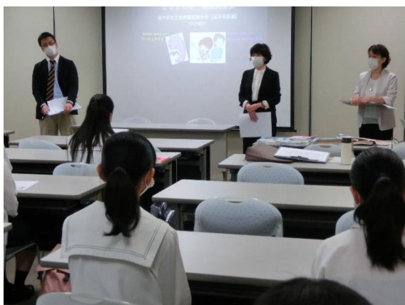
↑ ↓ 福井会場：面接官による講評

毎年大好評の、模擬面接会を行いました。今回は回数を減らし他施設の大きな会場を使って、密を避けたスケジュールにし、福井・敦賀で9月と10月に行い31名が参加。