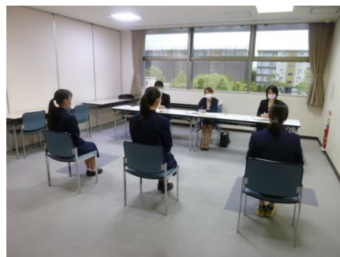
↓ 敦賀会場：3人面接の様子

敦賀会場：面接終了後につるが訪看ハピナスの看護師からアドバイスや心構えなどを聞いています。↓